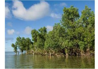
Alvaro Dahik-Garzozi consultor

Revisión, evaluación y actualización del Plan de acción regional para la conservación de los manglares en el Pacífico Sudeste (Par-Manglares)